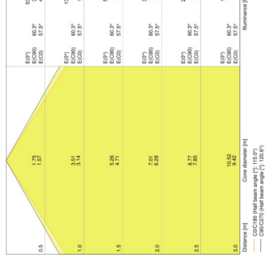
O FACADE SPOT 8 W 3000 K IP54 WT