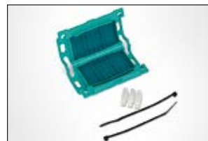
Gelmof Relifix 31,5.