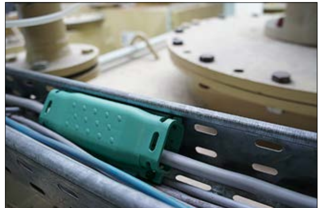
Gelmof Relifix V toegepast voor kabelreparatie.