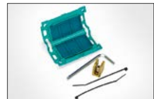
Gelmof Relifix V150.