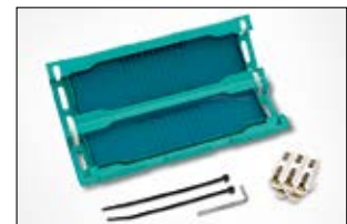
Gelmof Relifix V525.