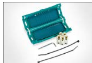
Gelmof Relifix V56, V516.