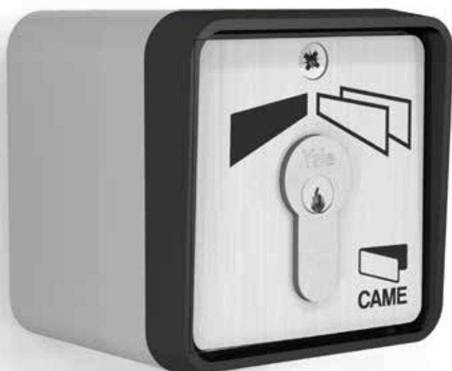
SET-E Sleutelschakelaar opbouw.

De sleutelschakelaars van de serie SET zijn allemaal vervaardigd van gegoten aluminium en kunnen als opbouw of inbouw worden geïnstalleerd. Ze zijn bestand tegen weersinvloeden, pogingen tot braak en vandalisme. Verkrijgbaar in de uitvoering met gepersonaliseerde sleutel of met magnetische sleutel.