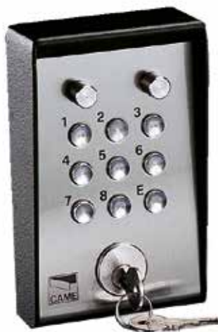
S5000 Codeklavier opbouw van verzinkt en gelakt staal met verlicht frontpaneel. 16.777.216 combinaties.

De serie SET biedt tevens, om aan de meest complexe eisen te voldoen, een transponder in de speciale stand-alone-uitvoering, waarmee alleen aan bezitters van een transponderkaart, -sleutelhanger of tag toegang wordt verleend. Het model TSP01 kan tot 250 verschillende kaarten opslaan en de programmering is beveiligd met een masterkaart.