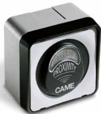
TSP01 Transpondersensor in stand-alone-uitvoering