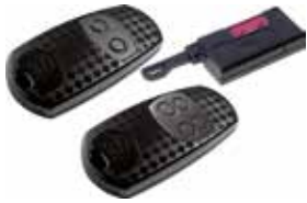
TOP-432EV • TOP-434EV • TOP-432S