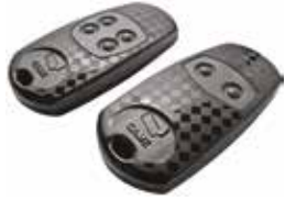
AT02 • AT04

Verkrijgbaar met 2 en 4 kanalen voor meerdere gebruikers, of met 2 kanalen in extra kleine uitvoering: Top is de meest veelzijdige en meest gebruikte handzender voor automatiseringen in woonomgevingen. De modellen TOP-432EV en TOP-434EV bieden 4096 combinaties en zijn voorzien van een zelfleerfunctie voor de overdracht van de rf-code van zender naar zender.