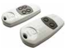
TOP-862EV • TOP-864EV

"Key Code" is de technologie waarbij een code moet worden ingetoetst om toegang te krijgen tot de programmering. Hiermee kan de zelfleerfunctie voor de code-overdracht van zender naar zender worden gecontroleerd en kunnen ongeautoriseerde duplicaties van de apparaten worden voorkomen. Twin biedt 4294967896 combinaties, is verkrijgbaar met 2 of 4 kanalen en biedt tevens ruimte aan een tag, waarmee de functionaliteit wordt vergroot bij aansluiting aan toegangscontrolesystemen van CAME.