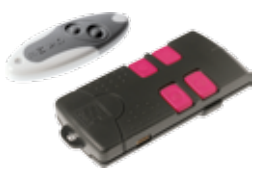
TAM-432SA • T438

"Rolling Code" is de technologie waarmee de code die door de zender verzonden wordt altijd verandert, waardoor het rf-sigitaal moeilijker te klonen en dus veiliger is. Om een nog grotere veiligheid te garanderen is Atomo voorzien van 4294967896 mogelijke combinaties en verkrijgbaar in een uitvoering met 1 of 2 kanalen. De zelfleerfunctie voor de code-overdracht van zender naar zender is een van de geavanceerde eigenschappen van dit product.