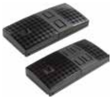
TWIN2 • TWIN4

Zenders voor meerdere gebruikers, ideaal voor gebruik bij appartementengebouwen. Er zijn 2 modellen verkrijgbaar, met 2 of 8 kanalen, alle voorzien van zelfleerfunctie voor de code-overdracht van zender naar zender.