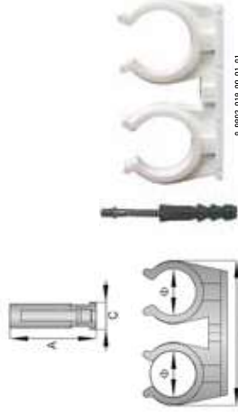
Dane logistyczne, Packaging, Verpackung, Упаковка