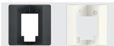
Adapter voor binnen- of buitenhoekmontage