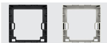
Afstandsraam voor de doorgang van zij-, boven- of onderkabels. Montage tussen de sokkel en de melder.