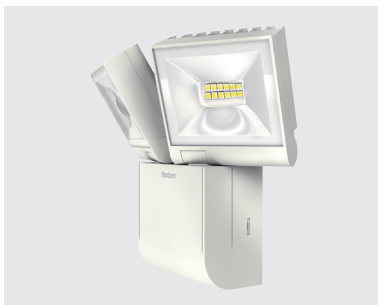
theLeda S20L WH