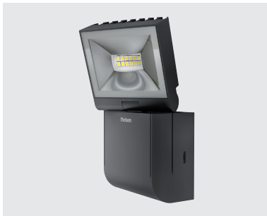
theLeda S10L BK