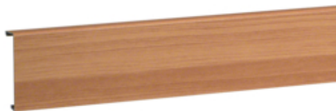
SL, deksel 20x80 mm, beuken